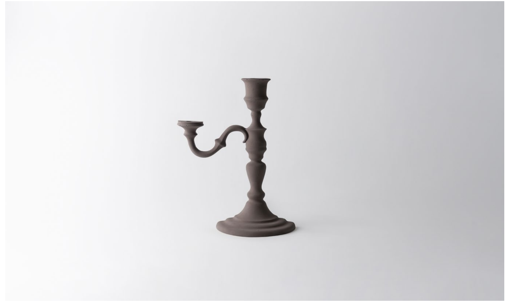
Candelabro marrone | Brown candelabra cm Ø 17 H 32 | MO226CBR