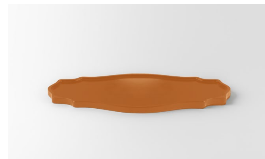
Vassoio 2 | Tray 2 legno laccato bianco opaco | matt white lacquered wood cm 50x25 | OU31150WH legno laccato nero opaco | matt black lacquered wood cm 50x25 | OU31150BK legno tinto eucalipto | eucalyptus-stained wood cm 50x25 | OU31150BR legno laccato arancio opaco | matt orange lacquered wood cm 50x25 | OU31150OR