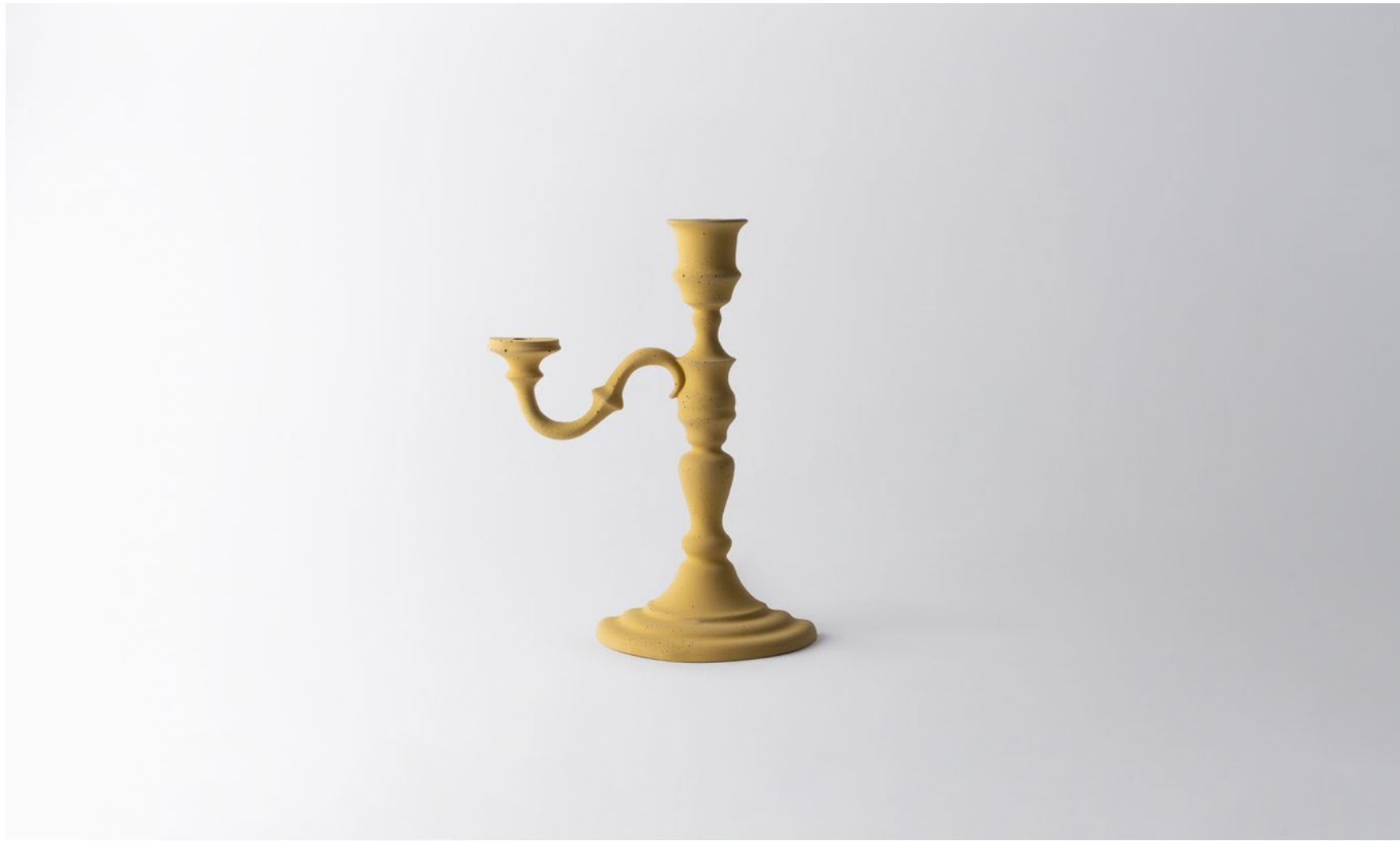
Candelabro giallo | Yellow candelabra cm Ø 17 H 32 | MO226CYE